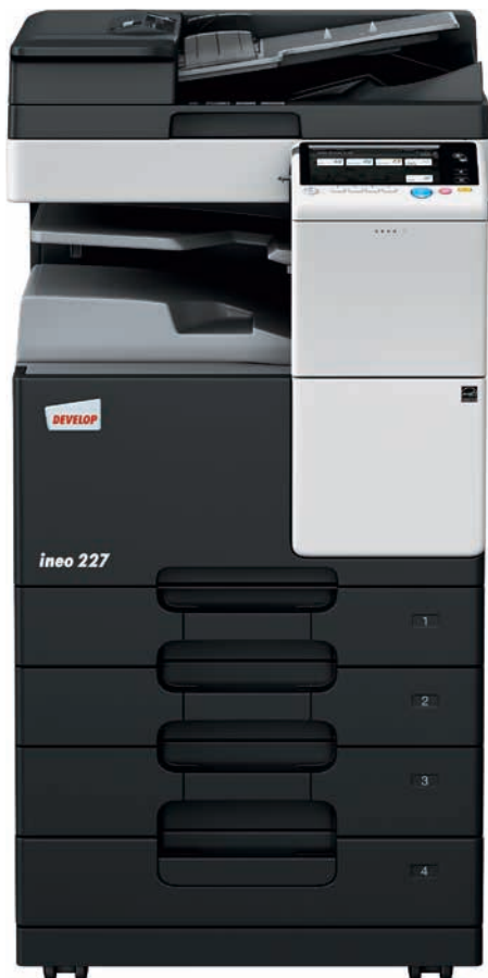
ineo 227 mit Duplex-Origineleinzug (DF-628), Zweifachablage (JS-506) und Papiereinzug (PC-213)