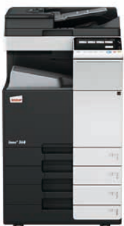
ineo+ 368 mit Dual Scan Original-einzug (DF-704), Ausgabefach (OT-506) und Papiereinzug (PC-210)

Wenn Sie in eine ineo+ 368 investieren, sind Sie in Bezug auf Spezialaufgaben, wie z. B. auf hochwertigem Karton gedruckte Einladungen, nicht mehr von externen Dienstleistern abhängig. Dadurch sparen Sie Zeit und Geld. Mit der ineo+ 368 können Umschläge, Recyclingpapier, vorbedrucktes Papier, OHP-Folien, viele andere Medien und selbst Karton bis zu einem Papiergewicht von 300 g/m 2 bearbeitet werden. Diese Systeme können zahlreiche Papierformate, von A6 bis A3+ (SRA3), sowie benutzerdefinierte Formate und Banner bis zu einer Länge von 1,2 Metern bedrucken. Außerdem ermöglichen die vielfältigen Endbearbeitungsoptionen das Erstellen bis zu 80-seitiger Broschüren, verschiedene Arten des Brieffaltens, das Heften von Handouts oder Lochen von Rechnungen. Mit einer ineo+ 368 kann fast jeder Druckauftrag intern bearbeitet werden.