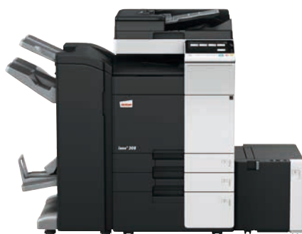
ineo+ 308 mit Dual Scan Original-einzug (DF-704), Heftfinisher mit Broschüre-einheit (FS-534SD), Großraumfach (LU-302) und Papiereinzug (PC-410)