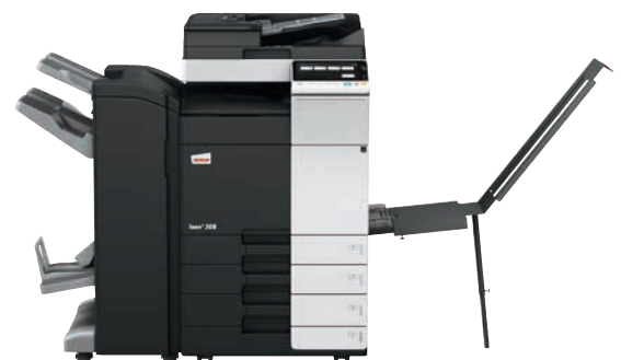
ineo+ 308 mit Dual Scan Original-einzug (DF-704), Heftfinisher mit Broschüre-einheit (FS-534SD), Bannereinzug (BT-C1e) und Papiereinzug (PC-210)