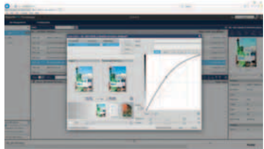
STONE CURVE UTILITY